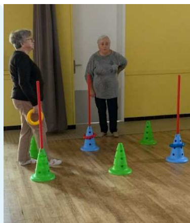
Quelques exercices d'équilibre

Devant la satisfaction des participantes à cette première expérience, on ne peut que souhaiter qu'une nouvelle session d'ateliers soit ouverte prochainement.