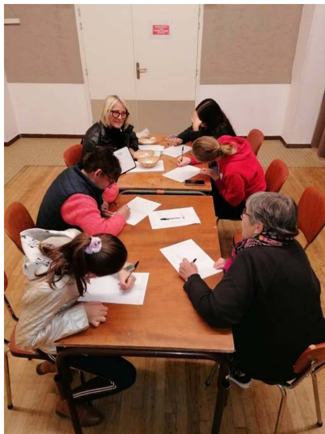
Atelier d'écriture le 8 novembre 2023

Prochaine édition de l'API TRUCK'S, samedi 16 décembre 2023 à partir de 17 heures à la salle polyvalente.